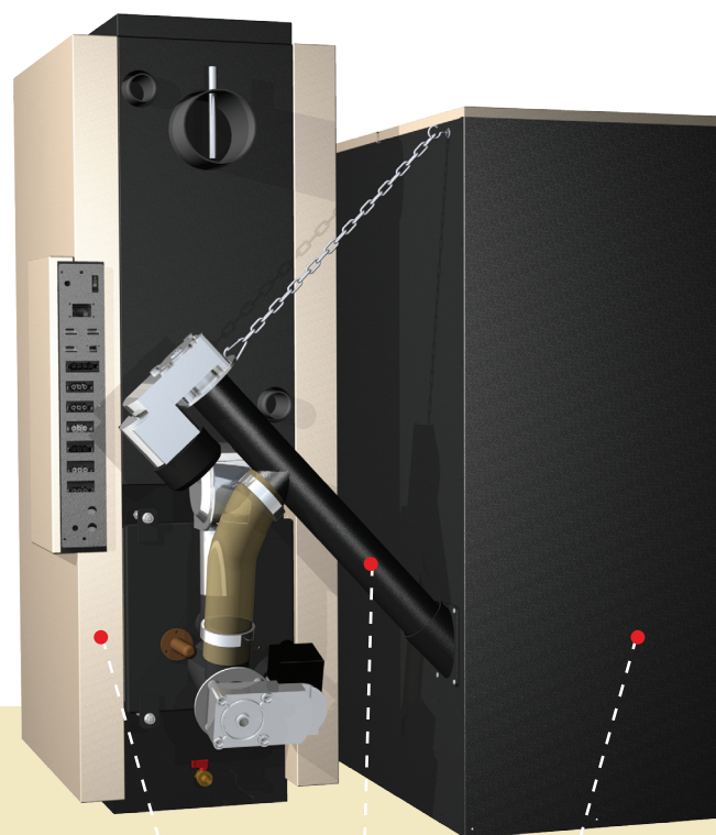
kotel | podavač P1 | zásobník